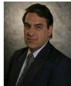
Director Escuela Sabática de la División Sudamericana